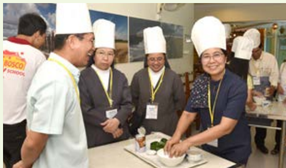
「學習的樂趣」環節由鮑思高酒店培訓學校主廚負責教烹調當地小食。