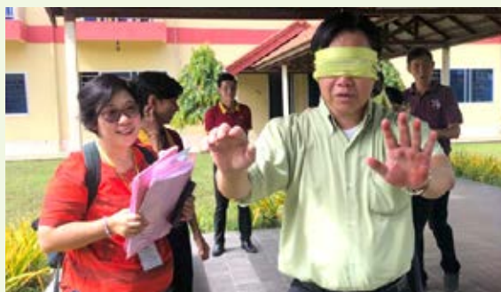
中華會省負責的團隊建設遊戲「明日之後」——尋找自己的夢想。